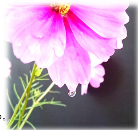
南高農園コスモス(2019年11月撮影)

月の雫とは「朝露」のことで、明け方に空気が冷えて大気中の水蒸気が水滴となって、草木の表面を覆う。朝露を“月がこぼしていった雫”とはよく表現したものである。昔の人々は、雨が降ったわけでもないのに葉を濡らす水滴の存在を不思議に感じていたであろうことが、万葉集や古今和歌集からも窺える。月が雲で隠れない夜は、放射冷却によって大気が冷え込み翌朝には透明な露が生まれるが、太陽が昇るとともに蒸発してなくなってしまふ。たぶん、月と露を結びつけて、美しくも儂い「月の雫」という言葉が生まれたのであろう。科学的な知識はなくとも、昔の人のセンスの良さには感服させられる。