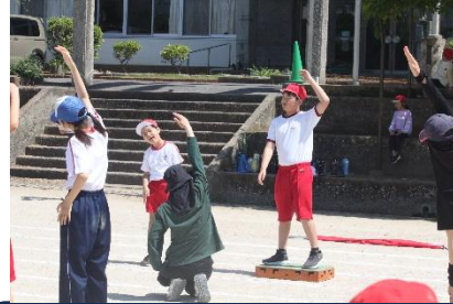
「プログラム1番、準備体操」で、みんなの前で赤組の師範をします。