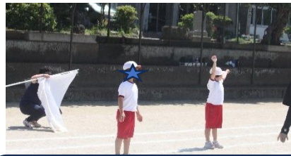
「プログラム1番、準備体操」で、みんなの前で白組の師範をします。