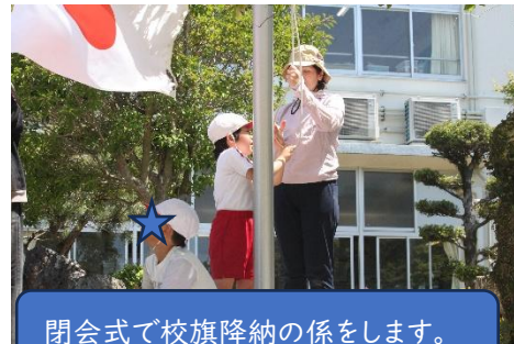
閉会式で校旗降納の係をします。