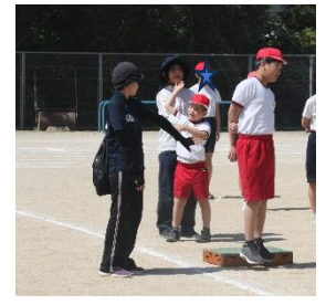
暑くても頑張ります。