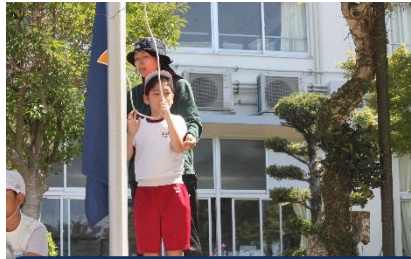
開会式で、校旗を掲揚します。