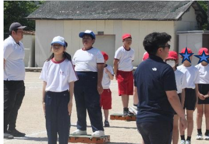
中学生は、姿勢もばっちりですね。前に立つ先生などをしっかりと見て、話を聞く姿が立派ですね。