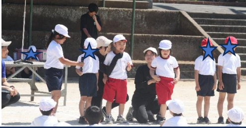
開会式では、僕たち1年生が挨拶をします！

運動会では、競技の他に、「自分の係」があります。今回は、児童生徒がどんな係を担当するのか、練習の様子からご紹介します。また、係がなくても集団の動きやペースを守って行動することも大切です。