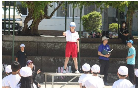
閉会式で、虹の原の校歌を指揮をします。