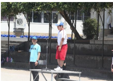
閉会式で挨拶をします！