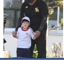
しっかりと立って待ちます。