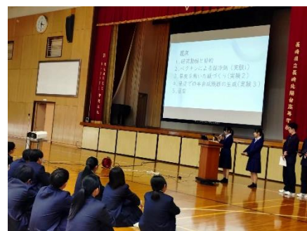
理数探究研究発表(化学班)