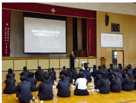
文理探究科ガイダンスの様子