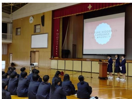
国際探究研究発表(言語班)