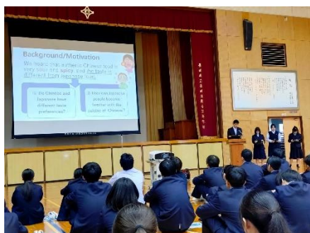
長崎外国語大学研修発表(中国語)