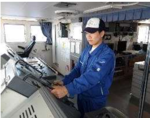
操舵実習(真っ直ぐ取れるか?)