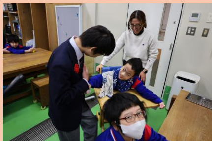
小学部3年生グループ

国語の学習で、小学部1年生と3年生に絵本の読み聞かせを行いました。相手の年齢や興味に応じて絵本を選び、当日は、声の大きさや表情、抑揚に気を付けながら読み聞かせを行いました。学習の成果を発揮したことで、小学部の児童に喜んでもらえてうれしそうな表情がたくさん見られました。お互いに充実した時間を過ごすことができました。