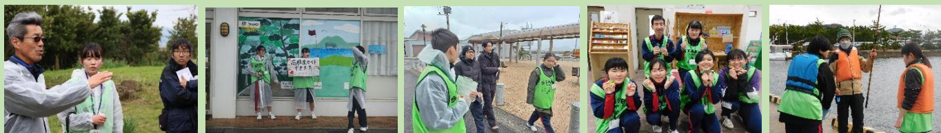
▲ 去年の地域探究 Days の様子