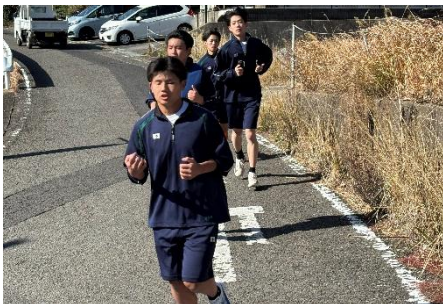
男子の部 第1位 2年1班