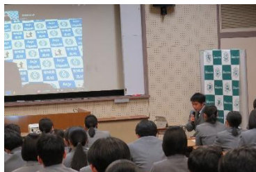
積極的に質問しています②