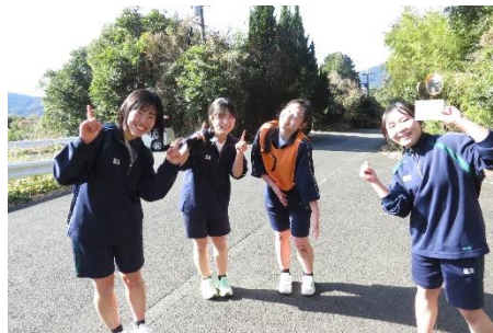
女子の部 第1位 2年7班