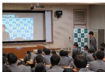
質問を受けています