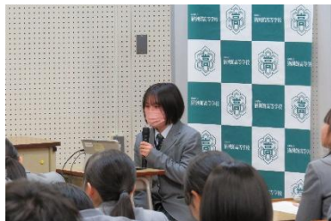
積極的に質問しています①

1月29日に本校2年生が愛知県の安城東高校と探究活動の交流会をオンラインにて行いました。両校から3班ずつ発表を行い、本校は安城東高校へ、安城東高校は本校へ発表についての質問をしました。両校ともに多くの質問をしており、活発な交流会でした。他県の同級生の探究に触れ、非常に良い刺激を受けることができたと思います。