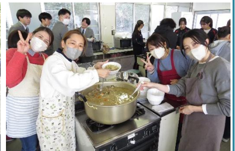
豚汁ありがとうございました！