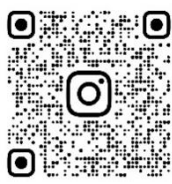
「シングルベル」の演奏♪

吹奏楽部が12月24日 クリスマスコンサートを行いました。 多くの生徒や先生が校舎の窓から演奏を楽しみました。 寒空の下でしたが、心が温まるひとときとなりました。 演奏は公式Instagramで視聴できます。 どうぞお楽しみください♪