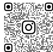
激励の様子 2年の猶興出典

数日前から緊張の面持ちでしたが、2年生の猶興出典をはじめとする校内での激励、家族のサポートのおかげで全力を出すことができました。進路決定まであとひと踏ん張り！