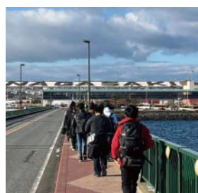
空港への橋を徒歩で渡る生徒たち