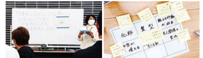
「思春期だなあと我が子の言動」について書き出し、話し合うワークショップ