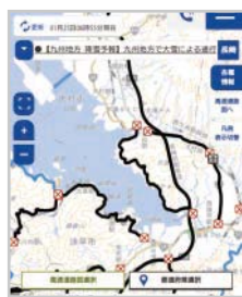
25日朝の道路交通情報 (黒い道路は通行止め)

そして迎えた当日の朝。気温は氷点下で道路は懸念通り各所で通行止めとなっていました。空は嘘のように晴れ渡り、飛行機は予定通り運航となりました。幸い大村工業高校は空港の目の前。一行は徒歩で橋を渡って無事に空港入りを果たし、大阪に飛び立つことができました。