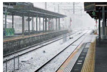
線路が雪で覆われたJR在来線(諫早駅)

前夜から降り始めた雪は次第に強まり、気温も低下。移動に使う予定だった空港リムジンバスも午後運休が決まり、急遽JR在来線での移動に変更となりました。積雪で長崎バイパスや高速道が通行止めになり一般道もほぼマヒ状態となっていく中で、JR在来線は最後まで運休することなく無事に大村入りを果たしました。そして空港に近い大村工業高校にご協力いただき、校内の合宿施設「放虎寮」に宿泊して翌朝に備えることができました。