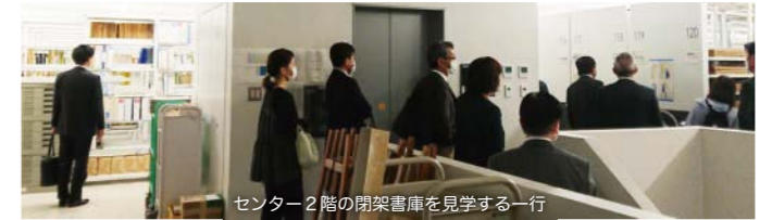
センター2階の閉架書庫を見学する一行

総会のあと、郷土資料センターの資料閲覧室および日頃入れない閉架書庫の中まで見学をさせていただきました。その後は「思春期の子どもへの上手な関わり」をテーマに、ながさきファミリープログラムのワークショップを皆で体験し、意見交換と交流を深めることができ、実り多い会となりました。