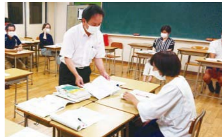
各教科ごとに担当の先生から説明を受けました

長工定ではどの教科も、複数の選択肢の中から「より見やすく、生徒が理解しやすい」事を重視して選んでいると感じました。