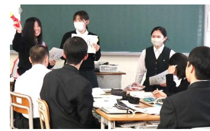
「授業フェア」 2年言語文化の一幕です