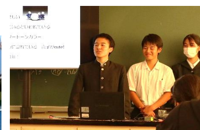
「1年総探プレ発表会」 佐世保の魅力を熱く語っています♪