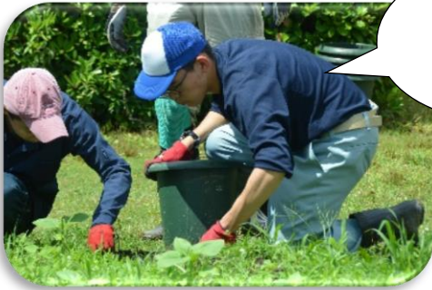
野外での 除草作業

高等部3年生は6月10日～28日の3週間、前期現場実習を行いました。3年生の実習は「進路先を決める」実習です。毎日通勤し、決められた時間、集中して作業をすることの大変さや、利用者・職場の方とコミュニケーションをとることの難しさなど働く大変さを学び、卒業後の進路を深く考える良い機会となりました。