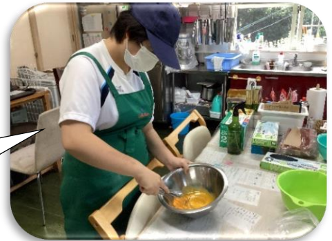
カフェでの ケーキ作り