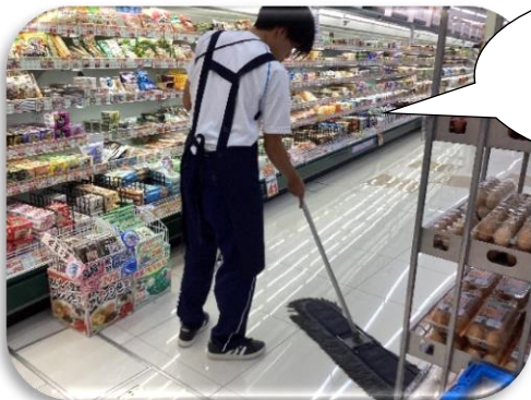
「店舗内清掃」 すみずみまできれいに