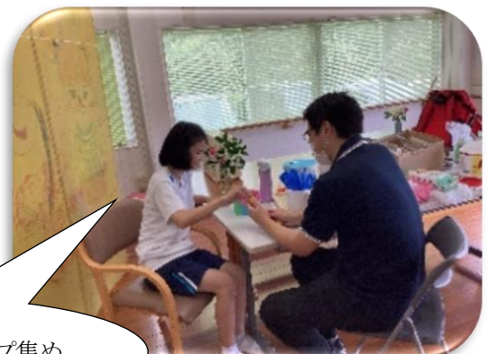
ペットボトルキャップ集め