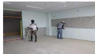
クラスルーム(教室) 壁の塗装