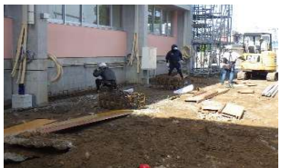
しつかいき 室外機を置く土台を作る工事(機械基礎工事)

工事もおと少しで終わりますが、気を緩めず、完成・引渡しまで無事故で終わるよう頑張ります。よろしくお願いたします。