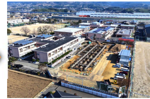
2023年12月 基礎工事開始