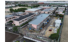
2024年6月 足場解体完了