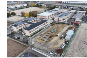
2023年11月 杭工事、土工事開始