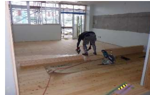
クラスルーム(教室) 床フローリング貼り