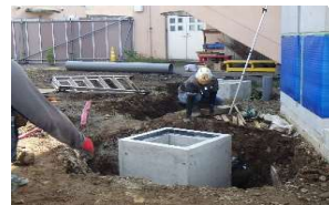
うすいます 雨水枡(学校が立っている土地内の雨水を溜める場所)

外構工事の進捗状況 建物周りをきれいにしています。最後にもうひと仕上げ残っています。