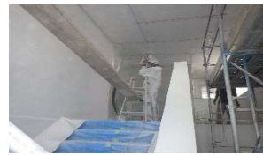
階段室壁吹付仕上げ