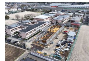
2024年2月 足場設置・1階躯体施工