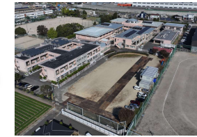
2023年10月 現場事務所の設置と 工事用車両のための鉄板敷き完了