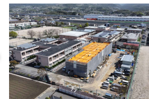
2024年3月 渡り廊下・2階躯体施工