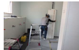
便所仕切り壁組立