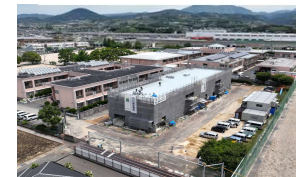
2024年5月 内外装工事開始