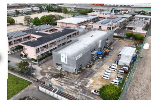
2024年4月 渡り廊下・ 本体躯体施工完了