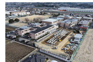
2024年1月 基礎コンクリート完了