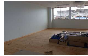
クラスルーム(教室) 仕上げ完了