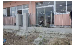
バルコニー手すり 取り付け