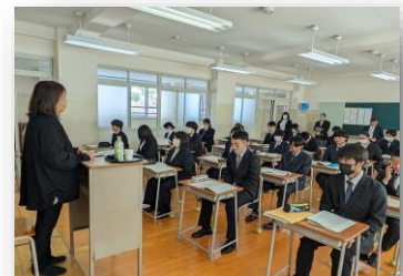
外部講師を招いてのマナー講座