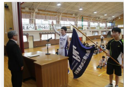
県定通大会激励会