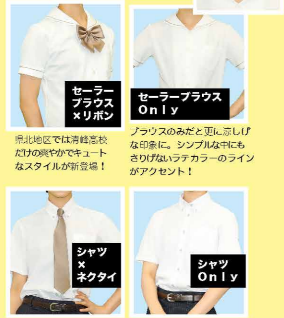
セーラーブラウス×リボン 東北地区では清峰高校だけの爽やかでキュートなスタイルが新登場！ セーラーブラウス Only ブラウスのみだと更に涼しい印象に。シンプルな中にもさりげないラテカラーのラインがアクセント！ シャツ×ネクタイ 男女問わずシャープでキリッとした印象に。スカートに合わせるとカッコ可愛く決まるよ！ シャツ Only 全部ボタンをとめて、きちっと着るもよし。第一ボタンを開けて楽に着こなすのもOK。襟の内側にはさりげないチェック柄のラインあり！