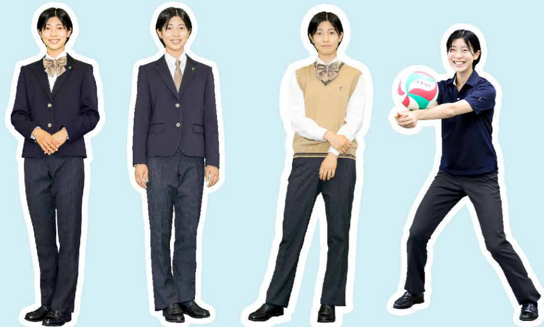
冬服×リボン 冬服×ネクタイ ベスト×リボン ポロシャツ

冬服×リボン 冬のパンツスタイルは寒さに強いのが魅力！リボンにすると、カッコよさに可愛らしさがプラスできるよ！ 冬服×ネクタイ クールでおしゃれな女子のパンツスタイルが新登場。動きやすさやカッコよさを重視したい人におススメ！ ベスト×リボン ベストなら少し暑くなってきても、袖をめくれば快適さUP！リボンを付ければパンツスタイルも可愛い印象に。 ポロシャツ 毎日汗をかく夏は、洗濯も大変！ポロシャツなら洗濯してもすぐに乾くから安心！ネイビーカラーがキュッと引き締まった印象に。