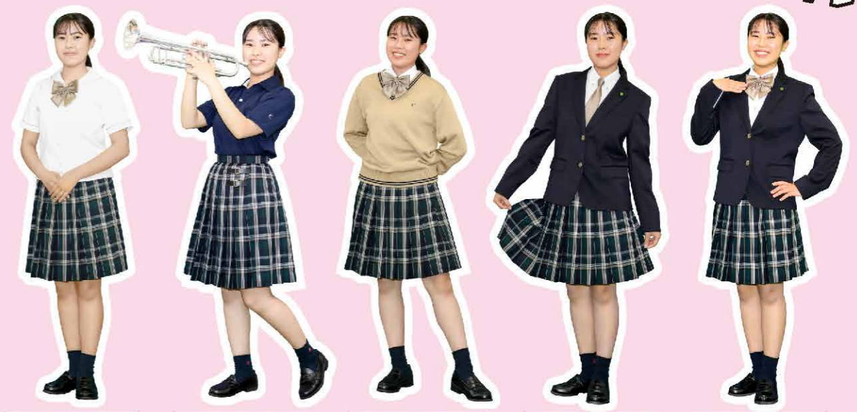
セーラー×リボン ポロシャツ セーター×リボン 冬服×ネクタイ 冬服×リボン

セーラー×リボン 清峰初のセーラースタイル！他にはない小ぶりの襟が爽やかで可愛らしい雰囲気を出してくれるよ♪ ポロシャツ 夏服オプションのポロシャツはとにかく爽やか！外に出して着てもよし。INして着るとウエストマークされて脚長効果があるのかなとか・・・？！ セーター×リボン ラテカラーのセーターがオシャレ◎実はスカートチェック柄にも同じカラーのラインが隠れてるよ(^ω^) 冬服×ネクタイ ネクタイに変えると可愛さに加えて大人っぽくてカッコイイ印象に。これなら勉強も捗って、成績UPしちゃうかも？！ 冬服×リボン ネイビーのプレザー+オリジナルチェックのスカート+大ぶりリボン=THE王道スタイルの完成！ラテカラーのリボンがポイント♪