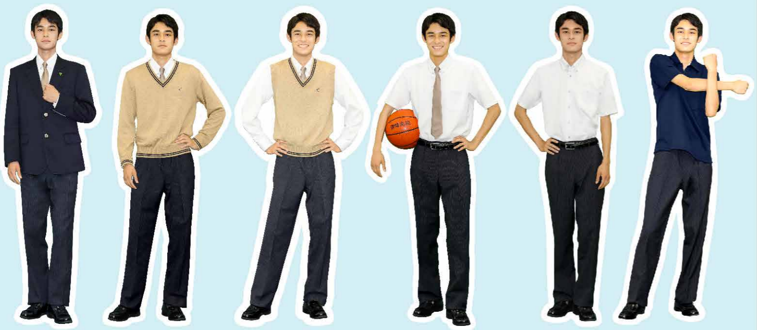
冬服×ネクタイ セーター×ネクタイ ベスト×ネクタイ 夏服×ネクタイ 夏服 ポロシャツ

セーラー×リボン 清峰初のセーラースタイル！他にはない小ぶりの襟が爽やかで可愛らしい雰囲気を出してくれるよ♪ ポロシャツ 夏服オプションのポロシャツはとにかく爽やか！外に出して着てもよし。INして着るとウエストマークされて脚長効果があるのかなとか・・・？！ セーター×リボン ラテカラーのセーターがオシャレ◎実はスカートチェック柄にも同じカラーのラインが隠れてるよ(^ω^) 冬服×ネクタイ ネクタイに変えると可愛さに加えて大人っぽくてカッコイイ印象に。これなら勉強も捗って、成績UPしちゃうかも？！ 冬服×リボン ネイビーのプレザー+オリジナルチェックのスカート+大ぶりリボン=THE王道スタイルの完成！ラテカラーのリボンがポイント♪