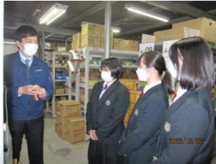
株式会社橘高様にて