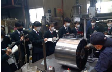
株式会社藤沢精工様にて