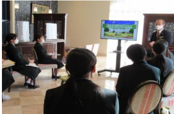
ホテル日航ハウステンボス様にて

市内を中心とする地元の11の事業所で、企業見学会を実施させていただきました。バス5台に分乗してコース別に訪問先企業へ移動し、地元企業への理解を深めることで、将来はふるさとに貢献したいという気持ちを高めることができました。佐世保市商工労働課、企業立地推進局、佐世保工業会、卸団地組合の皆様のご協力をいただきましたことに、あらためてお礼申し上げます。