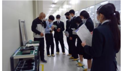
株式会社九州テン様にて