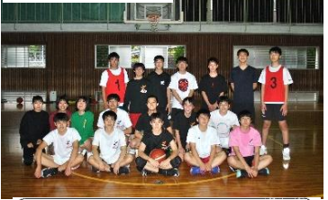
男子バスケットボール