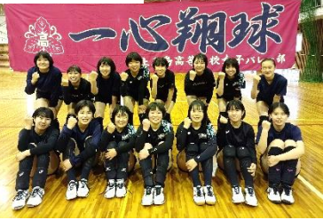
女子バレーボール