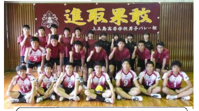
男子バレーボール