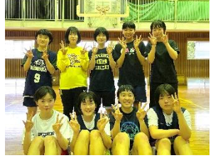
女子バスケットボール