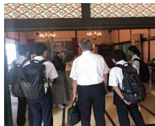
2年生 出島での様子