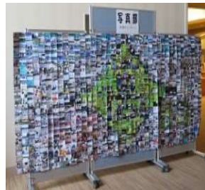
写真部 写真を使って校章のモザイクアート