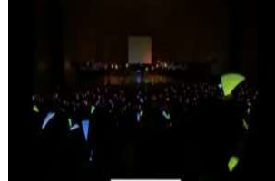
フィナーレの様子