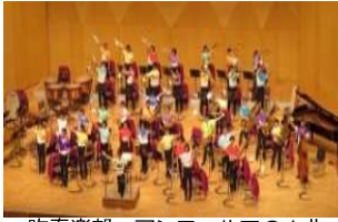
吹奏楽部 アンコールでの1曲