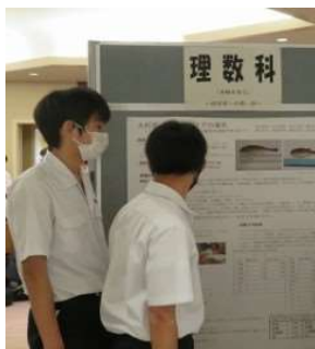
理数科 長大水産学部研修の発表