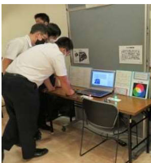
数理科学部 Arduinoのプログラミング