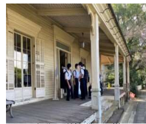
1年生 洋館巡りの様子