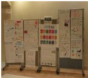
英会話部 SDGsについて英語でまとめました