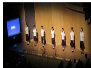
合唱部 オープニングでの校歌斉唱