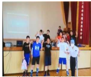
放送部 ラジオ番組作品