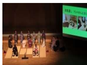
茶道部 お点前披露