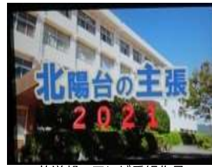
放送部 テレビ番組作品