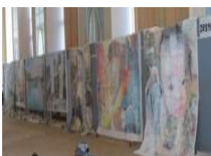
2年生 モザイクアート作品