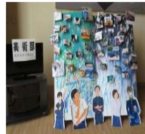
美術部 写真部の写真で本のオブジェ