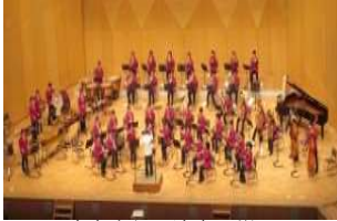
吹奏楽部 演奏の様子