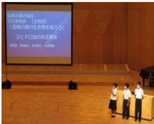
生物部 長崎の海の生き物について知ろう