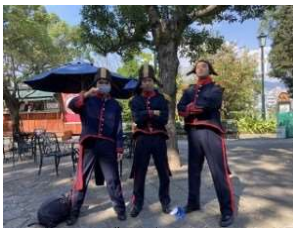
3年生 グラバー園での様子