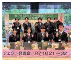
農業クラブ全国大会