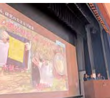
校内プロジェクト発表会