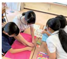
オープンスクール