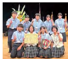
農業クラブ九州大会