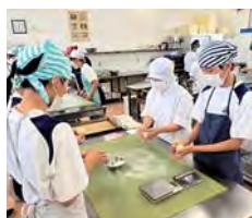
オープンスクール