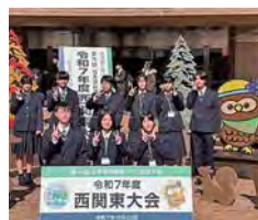
農業クラブ全国大会