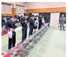
校内農業鑑定競技会