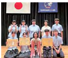
農業クラブ県大会