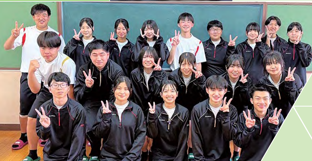
農業クラブ (生徒会)