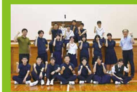
楽らくスポーツ部