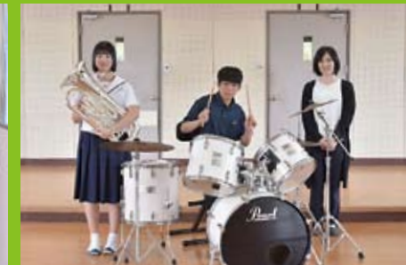
総合文化部(吹奏楽)