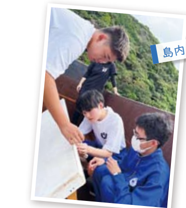
島内インターシッパ

自ら課題を見つけ、情報収集し、整理・分析してからまとめ・表現する課題解決的な学びに取り組みます。また、地域の皆様と協働することで、社会に貢献しようとする意欲を高め、自分の将来を考える機会を作っています。