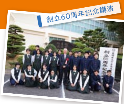
創立60周年記念講演

教育センターより、専門性の高い授業がリアルタイムで配信されます。教室では支援の先生もついているのですぐに質問ができて安心です。