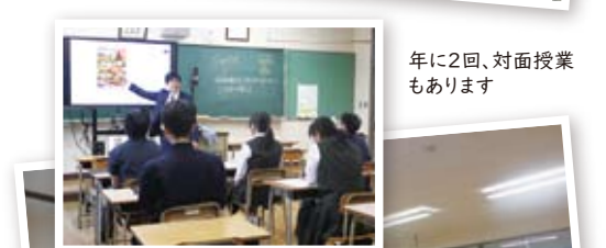
年に2回、対面授業も実施