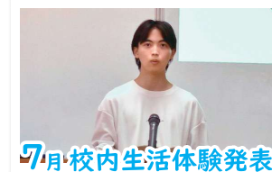
7月 校内生活体験発表

県下の定時制と通信制の生徒が集まり、全国大会出場をかけて戦います。過去には男子バドミントン部が団体で2位、個人で3位に入賞しました。