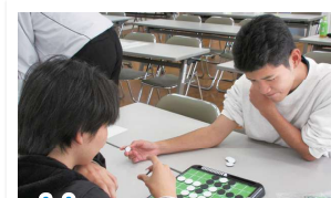
11月 中地区体育大会

体育的行事と文化的行事を1年ごとにしています。体育的行事の年には、学年の出し物としてダンスが行われます。