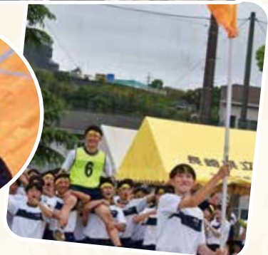
クラスで一致団結！目指せ優勝🏆