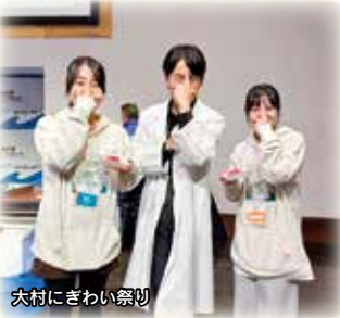
大村にぎわい祭り