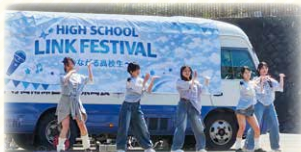
ハイスクールリンクフェスティバル

佐世保の高校生が集まって、繋がって、みんなで盛り上げる文化祭を企画！ 延べ7つの高校が9ステージ、9ブースで出演し、笑顔あふれる最高の1日となりました。 ひとりでは踏み出せない一歩も、南高の仲間と協力して自分たちだけの探究活動をしてみませんか？