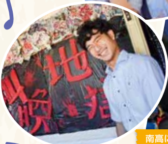
南高にしかない個性的な文化祭を心ゆくまで。