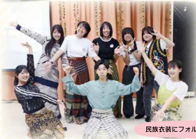
民族衣装にフォルムチェンジ！！

多文化が共存する国で、英語を使ったリアルなコミュニケーションに挑戦！ 班別研修では、最先端の都市や文化に触れながら、「自分で考えて行動する力」を育てます。 “楽しい”だけじゃ終わらない。