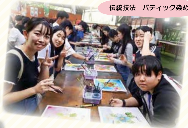
伝統技法 バティック染め