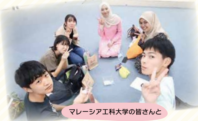
マレーシア工科大学の皆さんと