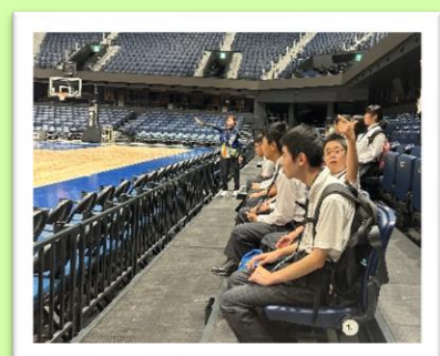
長崎スタジアムシティの見学 (高等部)