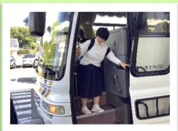
スクールバスでの 登下校の様子