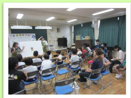
絵本の読み聞かせの学習 (小学部)