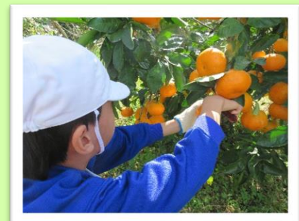
みかん狩り (小学部)