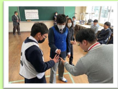
高等学校の生徒との学習 (高等部)