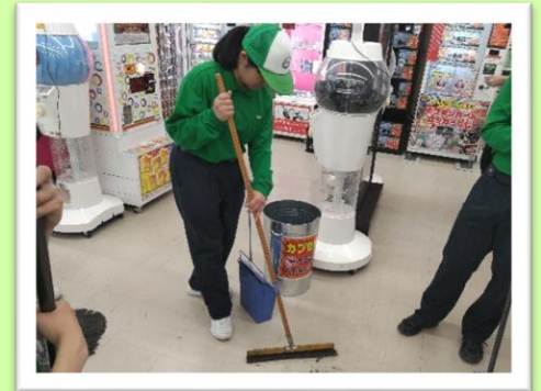
職業の様子 (サービス班)