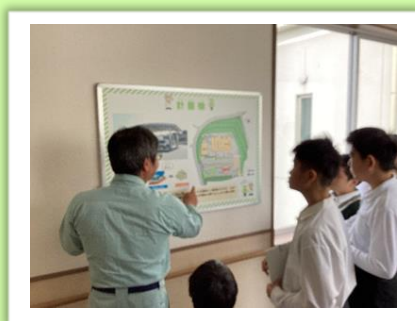
クリーンパーク長与の見学 (中学部)