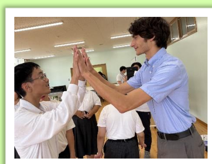
ALTによる英語の学習 (高等部)