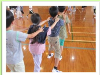
小学校の児童との学習 (小学部)