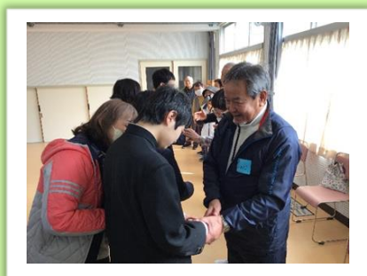
高齢者の方々との交流 (中学部)