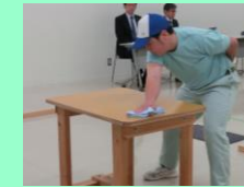
キャリア検定（清掃）