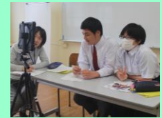
総合的な探究の時間 (吉岐分校とのリモート交流)