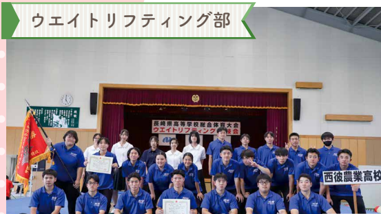
ウエイトリフティング部