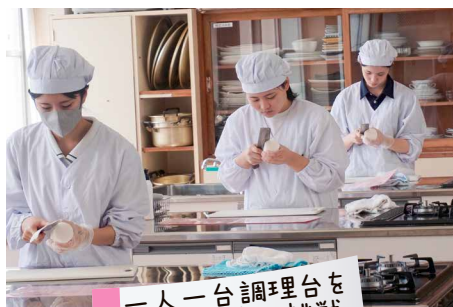
一人一台調理台を使って検定に挑戦