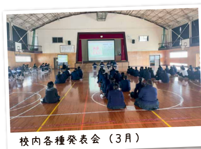
校内各種発表会 (3月)