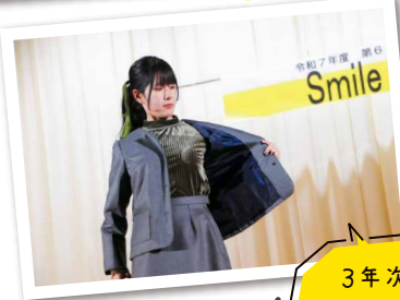
3年次には スーツを製作