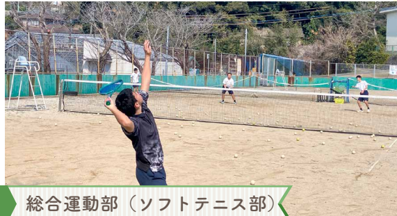
総合運動部 (ソフトテニス部)