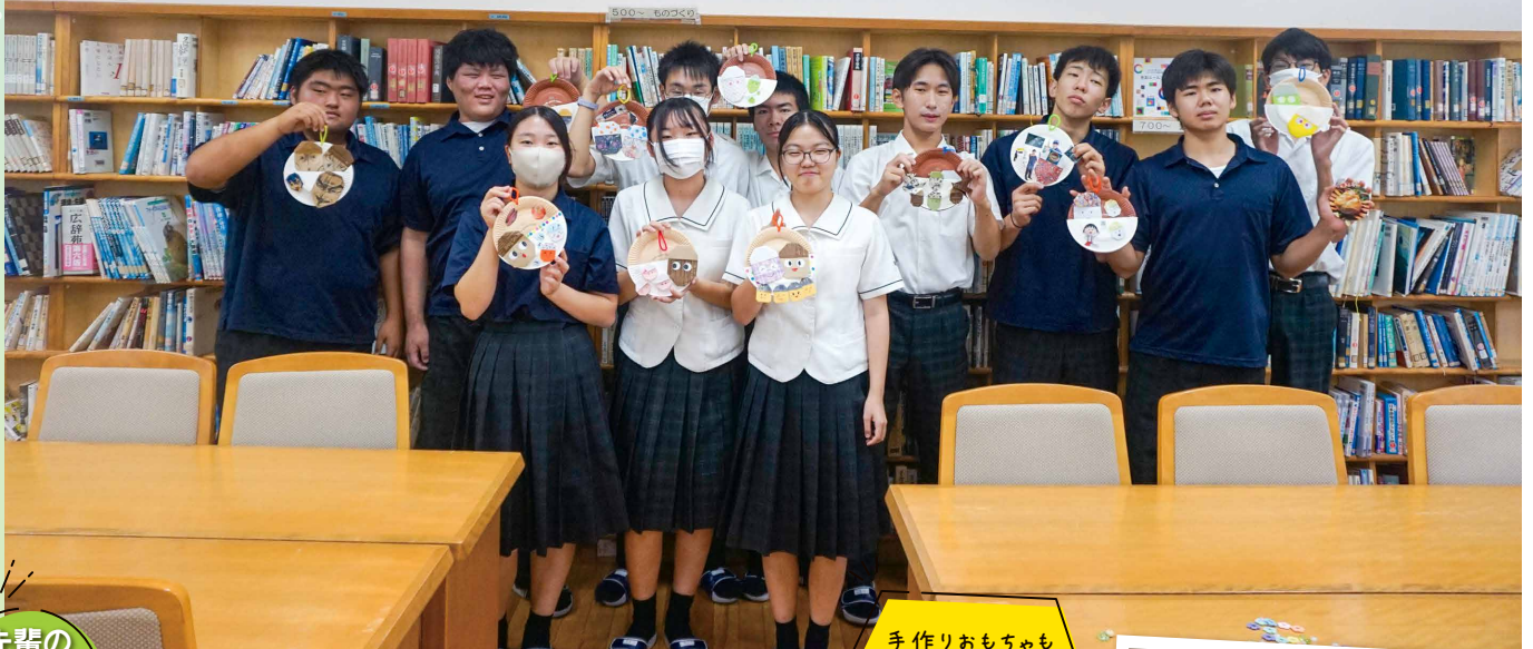
手作りおもちゃも大盛況!