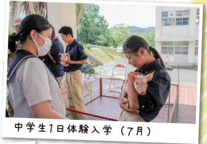
中学生1日体験入学 (7月)