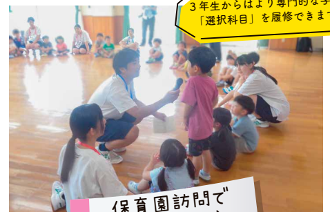
保育園訪問でレクリエーション