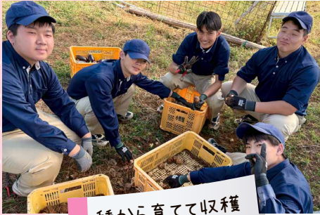
種から育てて収穫