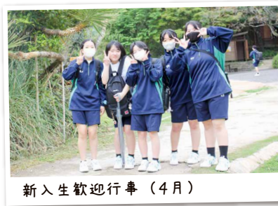
新入生歓迎行事 (4月)