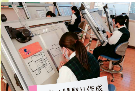
住宅の間取り作成