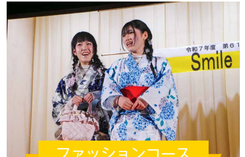
ファッションコース