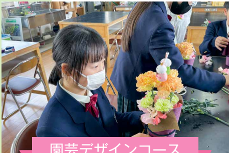
園芸デザインコース