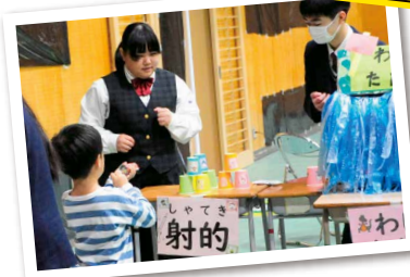
保育園訪問でレクリエーションや手作りペーパーサート