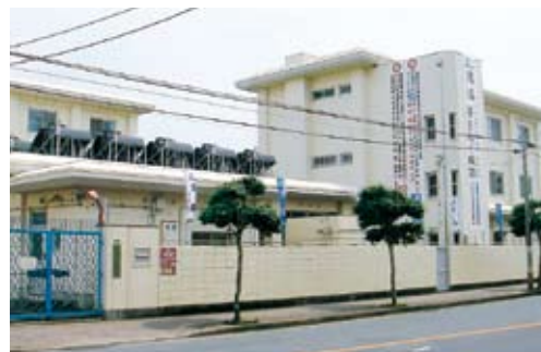
■ 学生寮 五島市池田町3-5(五島高校から徒歩5分)