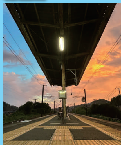
【県写真展】 優秀賞「きょうとあす」 平松 春乃