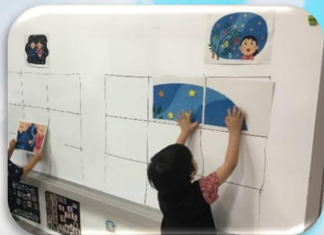
< 幼稚部 >