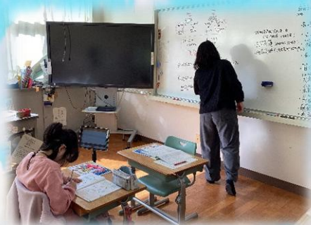
< 小学部 >