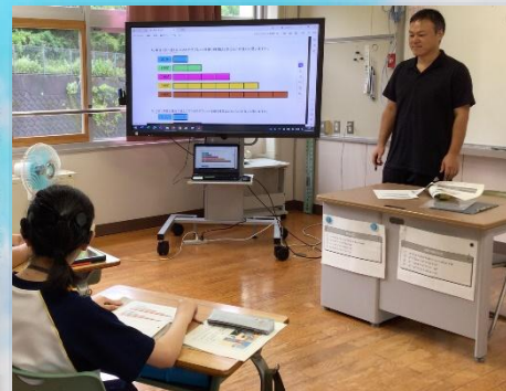
< 中学部 >

分教室は、県北地区の幼児児童生徒たちが在籍しています。聴覚活用を促しながら、一人一人の実態に応じたコミュニケーション手段を活用し、言語力と学力の向上に努めています。また、地域の保育所や小学校・中学校、居住地校との交流及び共同学習などを行い、豊かな人間性や社会性を育てています。併せて、教育相談や地域支援教室を行うなど、県北地区における特別支援教育のセンター的役割を担っています。