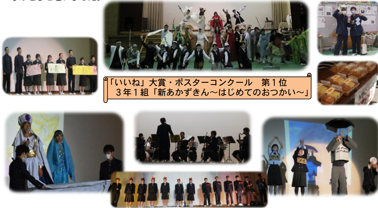
「いいね」大賞・ポスターコンクール 第1位 3年1組「新あかずきん~はじめてのおつかい~」

10月31日(土)「千紫万紅~咲かせよう71人の笑顔~」のスローガンのもと、白魚祭を開催しました。今年度はコロナ禍ということで、例年よりも規模を縮小し、体育館でのステージ発表・展示のみの開催となりました。来場者も限られた中でしたが、各団体工夫を凝らし、大盛り上がりでの素晴らしい白魚祭となりました。また、感染症対策を十分に行っていたさながら、PTA母の会による食物バザーも実施しました。ご協力いただいた保護者の皆さま、本当にありがとうございました。