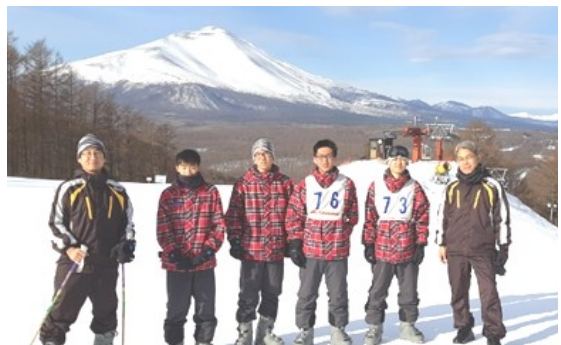
↑ 浅間山をバックに

3年生はあと一カ月で卒業です。卒業、そして進路が決定するその日まで、たゆまぬ努力を続けることこそが、次の旅へのステップとなります。1・2年生は、進級まであと二カ月。目の前の高校生活をしっかりと歩み続けることが、経験値を増やすこととなります。たくさんの経験値を積んで、未知の旅へ踏み出しましょう。