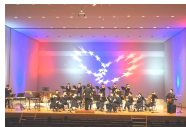
↑ の様子 ← 文化部合同発表会