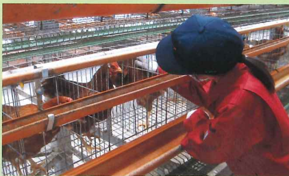
ニワトリの飼育管理

和牛を中心とした大動物、または中小家畜（鶏）やペット動物の飼育管理の知識、技術について学びます。