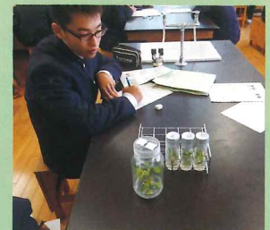
バイオテクノロジー実験