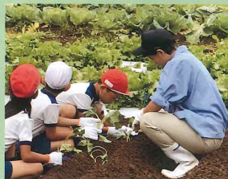
いも植え(小学校交流)