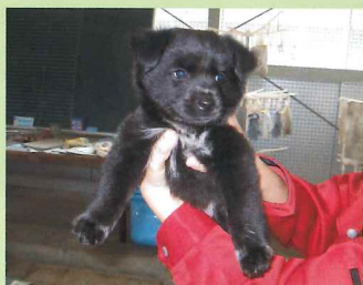
愛玩動物の学習:イヌ