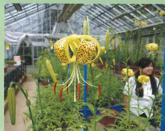
黄平戸ユリ増殖プロジェクト