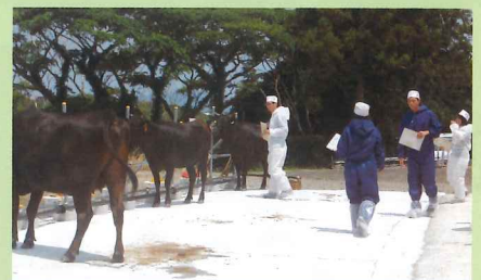
家畜審査競技会(和牛)