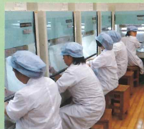
クリーンルーム内実験