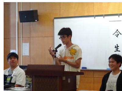
【平石生徒会長による説明】

6月25日（火）生徒総会が行われました。昨年度の活動経過報告、会計決算報告、今年度の活動計画や会計予算案の説明の他、「給食室前面への時計設置」「ペットボトル用ゴミ箱の撤去」など各クラスからの要望に対する回答も示されました。生徒総会は、みなさんの意見が反映される大変重要な会議です。生徒のみなさん一人一人が意見を出し合うことで、活気あふれるよりよい学校となります。