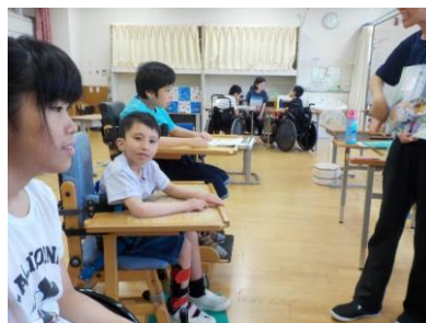
テレビ局について説明を聞く生徒

7月5日(木)からの修学旅行に向けた学習が行われている。旅先の福岡では班別行動があり、RKB毎日放送と、福岡タワーの2か所へ行く予定だ。29日(金)は班ごとに授業が行われた。各班は、放送局の仕事内容を本やタブレットで調べたり、歌に合わせて福岡タワーの姿を体で表現したりするなどしていた。旅行当日が晴天で生徒たちにとって楽しい思い出となることを期待したい。