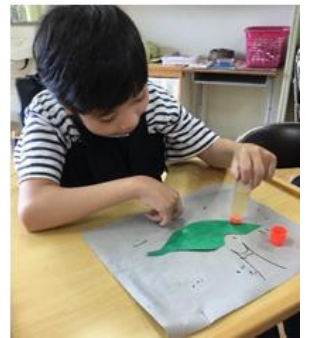
作品制作に一生懸命な生徒