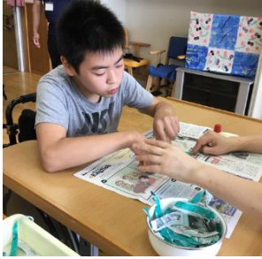
台紙にのりを塗る生徒

今回の授業のテーマは、「形のイメージをもとう」英字新聞を縦長にちぎって「花の葉」の形の台紙に貼る作業を行った。これは最終的に、春をイメージした「花」になり、中文祭に出展される。本番ではどのような「花」が咲き誇るのか、大いに期待したい。