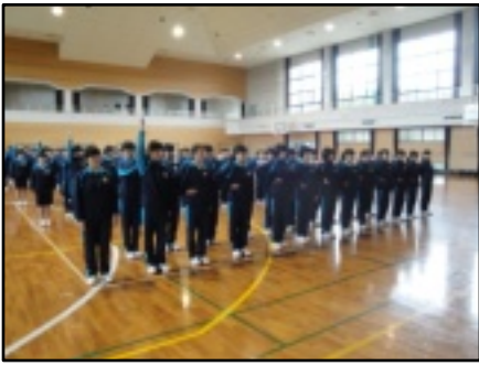
集団行動訓練の練習風景

四月二十四日(火)から二十六日(木)の三日間、佐世保青少年会館で宿泊研修を行いました。