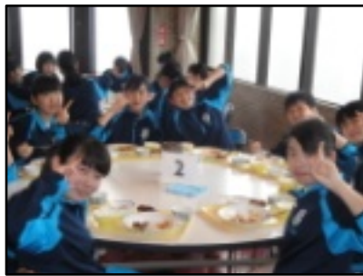
レストランでおいしい昼食

二日目は集団行動訓練を中心に実施しました。クラス対抗の長縄跳びでは、優勝は四組でした。また、数学、世界史、情報の学習方法や予習、復習の仕方を学びました。さらに、創造Iの「仲間を知る」というテーマでグループ学習もあり、充実した研修となりました。夜は、各クラスごとに、クラス目標を決めたり校歌練習をしました。