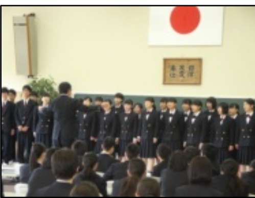
クラス目標を発表し校歌を斉唱する生徒＝大研修室

最終日は、研修の成果を示すクラス対抗の校歌の発表会でした。各クラスとも練習の成果を發揮し、元気の歌声を披露しました。優勝は四組でした。二泊三日の研修で本日の東翔高校の生徒に成長できたことと、高校生活の重要な体験となる貴重な体験となりました。