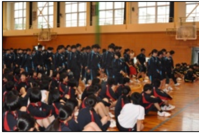
新入生の入場を拍手で迎える2、3年生＝本校体育館

五月二日(水)に歓迎遠足の予定でしたが、雨天のため体育館で歓迎行事が開催されました。開会行事で、校長先生は雨で残念ですが、生徒会も一生懸命レクリエーションを用意しているようです。今ここでしかできないことを楽しもうと挨拶されました。続いて生徒会長は、生徒会週間かけてレクリエーションを用意しました、たった半日ですが、みんなと楽しみたいと挨拶しました。次に、新転任の先生方が自己紹介をされ、メリハリのある元気いっぱいの学校生活を送りましょうと挨拶されました。