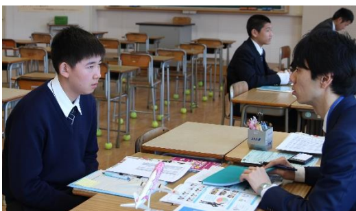
進学後のキャリアプランを考えて

7日（水）に進路ガイダンスを行いました。今回のガイダンスでは、進学と就職の2グループに分かれ、進学グループでは、はじめに進学後に必要な費用や生活等に関する説明をうけたのち、各学校ごとの説明会に参加しました。就職グループでは、面接をはじめとする就職活動全般に関する説明のあと、就職模擬試験や公務員講座の講義、2年生による模擬面接を行い、実際の就職活動の一端を体験しました。