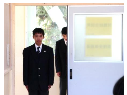
就職試験を疑似体験