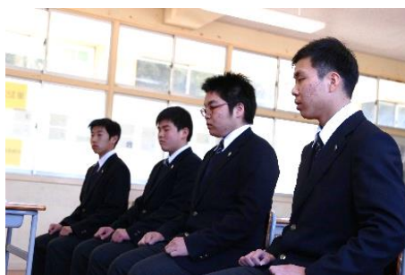
初めての模擬面接