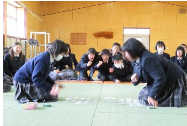
緊張感が会場を包んだ代表戦