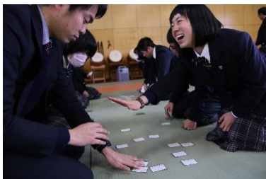
先生との勝負！

17日(水)、本校武道場において百人一首大会を行いました。全学年を4人ずつのグループに分けて札を取り合う個人戦と、各クラス2名ずつの代表戦を行い、これまでの取り組みの成果を披露しました。