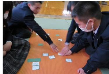
負けられない戦いが目の前に