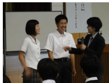
良い笑顔の作り方をレクチャー してくださいました