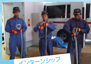
インターンシップ (職場体験)