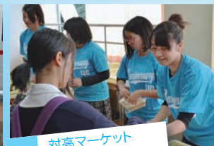
対高マーケット (販売実習)