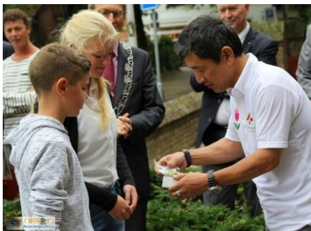
球根を渡しているところ