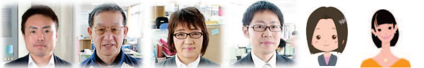
事務 国語 国語 福祉 家庭 キャリアサポートスタッフ